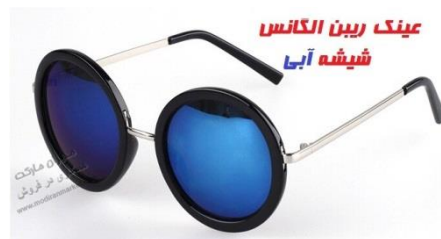
شکل ۲. عینک ریبین الگانس شیشه‌آبی

«عینک آفتابی ریبین الگانس شیشه‌آبی جدیدترین محصول سال ۲۰۱۵ کمپانی ریبین بوده و قابل ست با انواع چهره و صورت است و شما می‌توانید به دلیل سبک و استاندارد بودن این عینک آفتابی آن را در تمام طول روز بر چهره داشته باشید. عینک آفتابی ریبین طرح الگانس برای کسانی طراحی شده که از مدل‌های تکراری خسته شده‌اند و به دنبال طراحی خاص و جدید هستند. تاپ‌ترین و پرفروش‌ترین عینک آفتابی سال در اروپا و آمریکا عینک ریبین الگانس است. حتما شما هم این عینک را به چشم بازیگران و حتی مردم شهر خود جدیداً دیده‌اید.»